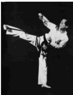
Generál Čve Hong-hi

V České republice se TKD vyučuje od druhé poloviny 80. let. Jsme za to vděční především korejskému mistru Hwang Ho-jongovi (VIII. Dan), který dlouhodobě pobývá v Praze za účelem šíření TKD nejenom v celé České republice. Na akcích naší školy má každý žák možnost seznámit se s touto jedinečnou osobností světového TKD. Naše škola je největší školou TKD v ČR a ve svých řadách má několikanásobné mistry ČR, Evropy, či světa. Všichni trenéři naší školy dodržují zásady TKD stanovené zakladatelem.